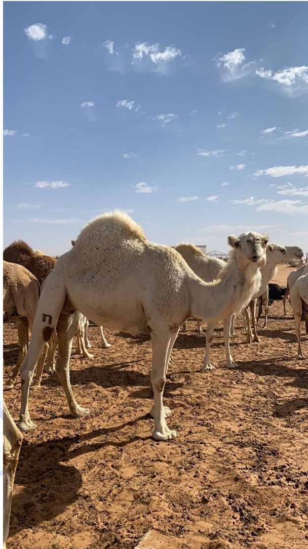
Figura 2. Camellos hospedadores intermediarios del MERS-CoV en Arabia Saudita.

americano. Posterior a la identificación del virus, se confirmaron los vínculos epidemiológicos entre los casos de los humanos y los camellos (Figura 2), que dieron como resultado el aislamiento del virus (12-14) .